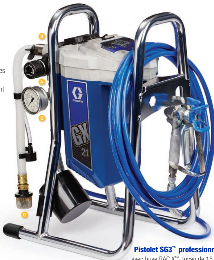
Pistolet SG3™ professionnel avec buse RAC X™, tuyau de 15 m.