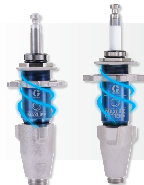
Pompe Endurance Vortex MaxLife

Dure 6X plus longtemps entre chaque repositionnement