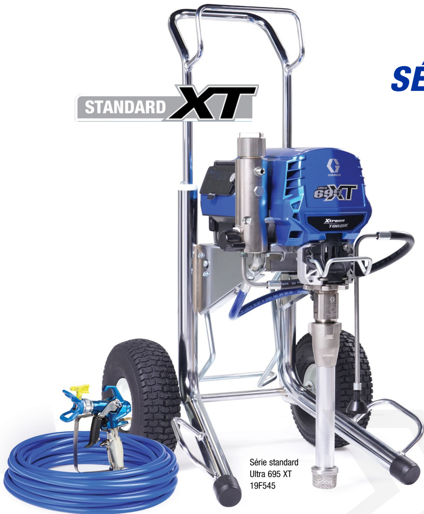
Série standard Ultra 695 XT 19F545