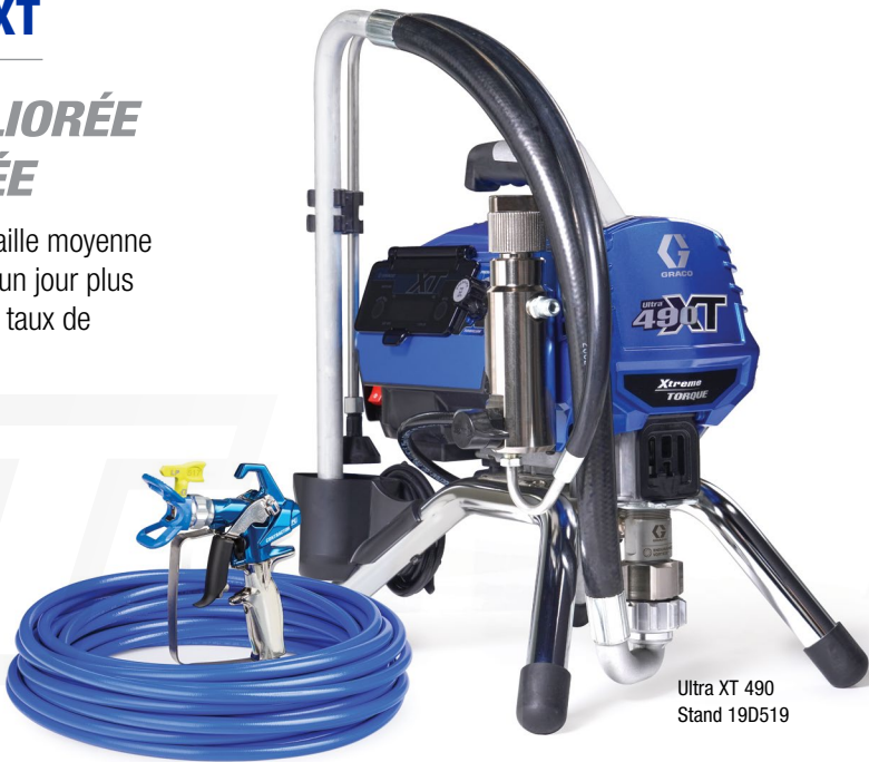
Ultra XT 490 Stand 19D519

Les pulvérisateurs airless électriques de taille moyenne permettent d’accomplir plus de travail en un jour plus facilement grâce à un meilleur débit et un taux de production plus élevé.