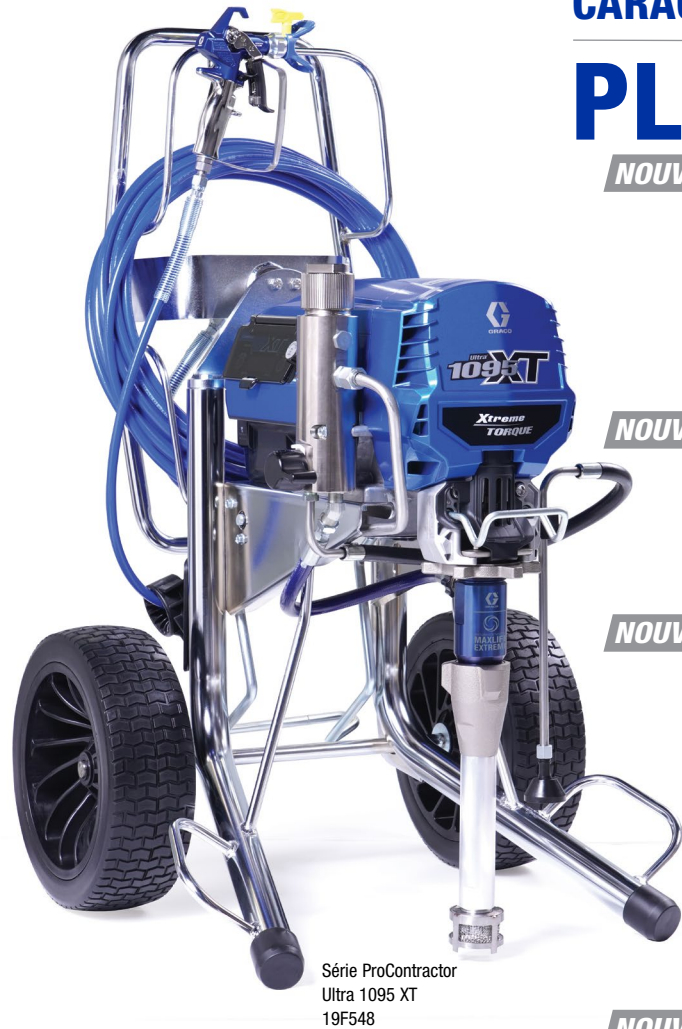
Série ProContractor Ultra 1095 XT 19F548

NOUVELLE AUGMENTATION DES PERFORMANCES PRÊT À PULVÉRISER AVEC : Pistolet Contractor PC RAC X LP517 SwitchTip et support de boyau sans air BlueMax II 1/4 x 50 pi (6,4 mm x 15 m)