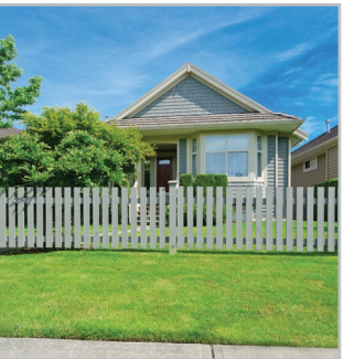
CLÔTURES / MOBILIER