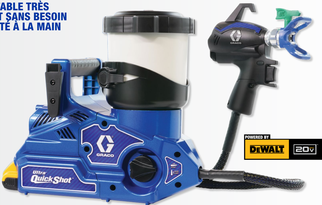
N° de pièce 20B473

PULVÉRISATION DE REVÊTEMENTS ARCHITECTURAUX À BASE D'EAU, DE SOLVANTS ET INFLAMMABLES SANS DILUTION*