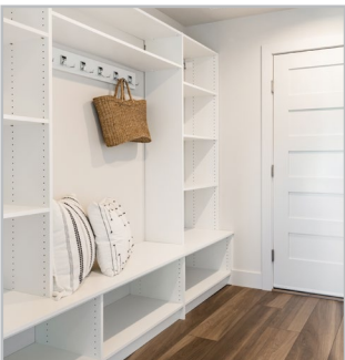
ARMOIRES / ENCASTREMENTS