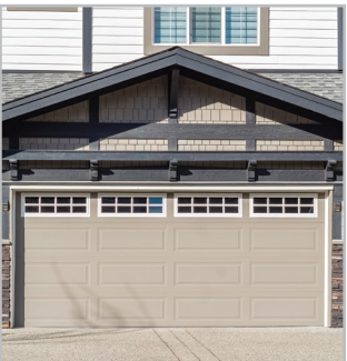
PORTES DE GARAGE