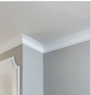
ORNEMENTS / MOULURES