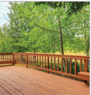
TERRASSES / GARDE-CORPS